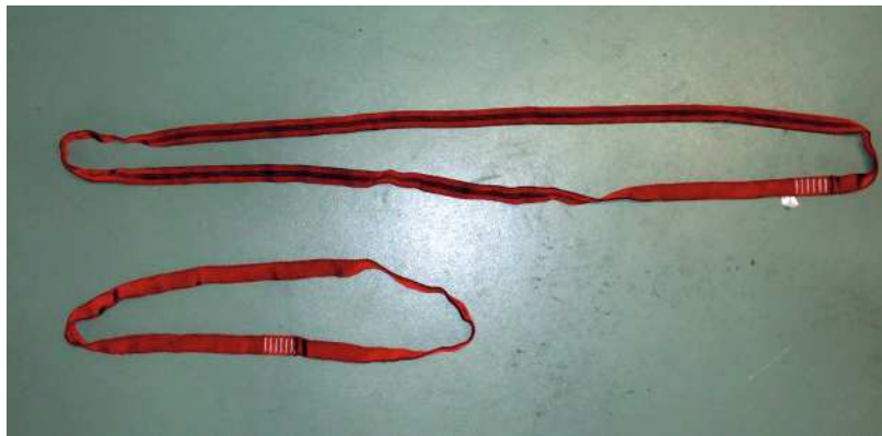
Abb. 16: Beispiele für Bandschlingen nach EN 354/EN 795B.

Bandschlingen gemäß DIN EN 354 und DIN EN 795 dienen als universelles Anschlagmittel und der Herstellung von Festpunkten und Anschlagpunkten sowie zur Herstellung einer Standplatzsicherung (Selbstsicherung).