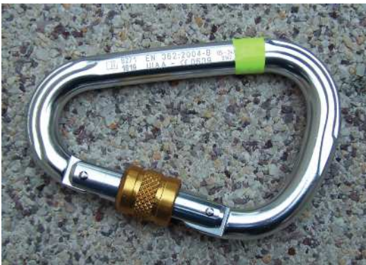
Abb. 10: Karabinerhaken mit Schraubverschluss.

Bruchlast (in Längsrichtung bei geschlossenem Verschluss) mind. 22 kN