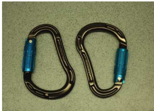
Abb. 11: HMS-Karabinerhaken mit Dreivegeverschluss.