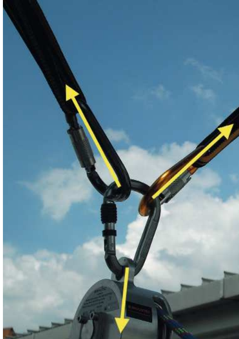
Abb. 14: Ungünstige Belastung eines Karabiners. Hier werden die entstehenden Kräfte an den Rundungen des Karabiners in diesen eingeleitet, wodurch eine Belastung in Querrichtung entsteht. In dieser Richtung weisen Karabiner eine geringere Festigkeit als in Längsrichtung auf.