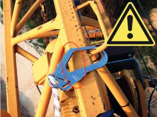
Abb. 13: Beispiel für mögliche Knickbelastung eines Gerüsthakenkarabiners als Bestandteil der Nahbereichssicherung im Falle eines Sturzes. Der Karabiner muss eine hohe Knickfestigkeit aufweisen, damit sich die Karabinerklinke nicht öffnet, in diesem Fall durch Ausführung in Stahl.