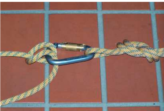
Abb. 15: Belastung von Karabinern im Rahmen der Einfachen Rettung aus Höhen und Tiefen immer in Längsrichtung. In diese Richtung weisen Karabiner eine weitaus höhere Bruchkraft auf.