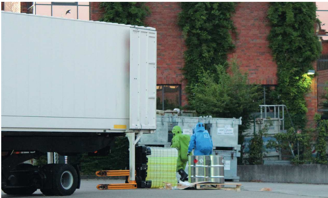
Abb. 59: Transportunfälle sind typischer Anlass für Gefahrstoffeinsätze