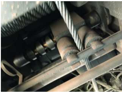
Abbildung 19: Bewegliche Seilführung auf Kreuznut- welle

Grundsätzlich ist bei der Anwendung darauf zu achten, dass die Seilwicklung auf der Trommel mit einer gewissen Vorspannung erfolgt (ca. 15 kN). Dadurch wird eine satte, gleichmäßige Aufwicklung erzeugt. Sollte das Seil zu locker auf der Trommel sein, kann es zu erhöhten Reibungskräften kommen, welche den Zustand des Drahtseils negativ beeinflussen. Zudem besteht die Gefahr, dass sich das Windenseil beim Anzug der Last in die unteren Lagen einschnürt und somit die sichere und reibungslose Funktion beeinträchtigt. Durch die Seilandruckrolle wird ein Aufdolden des Seils auf der Seiltrommel verhindert. Die automatische Seilwickelvorrichtung sorgt dafür, dass die Seilauflauf- und abwicklung jederzeit unter dem notwendigen Ablenkwinkel von 3^\circ bleibt. Dazu erfolgt die Seilführung durch ein zwangsgesteuertes Seilfenster.