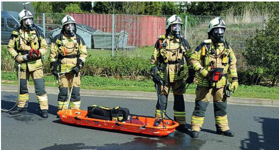
Abbildung 10: Atemschutz-Notfall-Trainierte-Staffel (ANTS) der Feuerwehr Kempen. Der Vierertrupp teilt sich die Ausrüstung je nach Funktion auf und kann so optimale Hilfe leisten.

Wird bei dem verunfallten Atemschutzgeräteträger ein Herz-Kreislauf-Stillstand festgestellt, empfiehlt sich nach der Rettung durch den Sicherheitstrupp die Anwendung der FD:CPR-Technik.