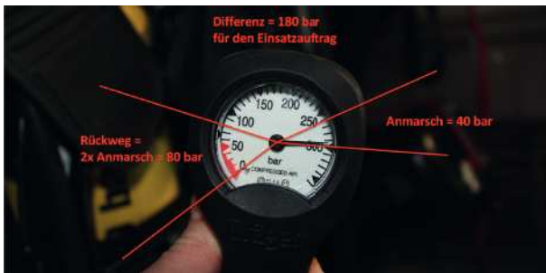
Abbildung 9: Manometer eines Atemschutzgeräts zur Veranschaulichung von Anmarsch, Rückweg und Luftvorrat für den Einsatzauftrag (Beispielwerte)