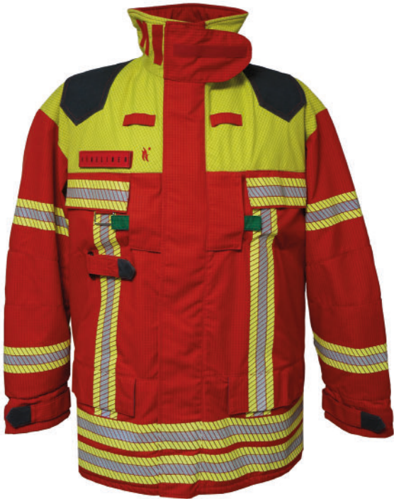
Bild 1: Der BIG FIRELINER® in »Transportstellung« in der Einsatz- jacke (erkennbar an den beiden grünen Laschen)