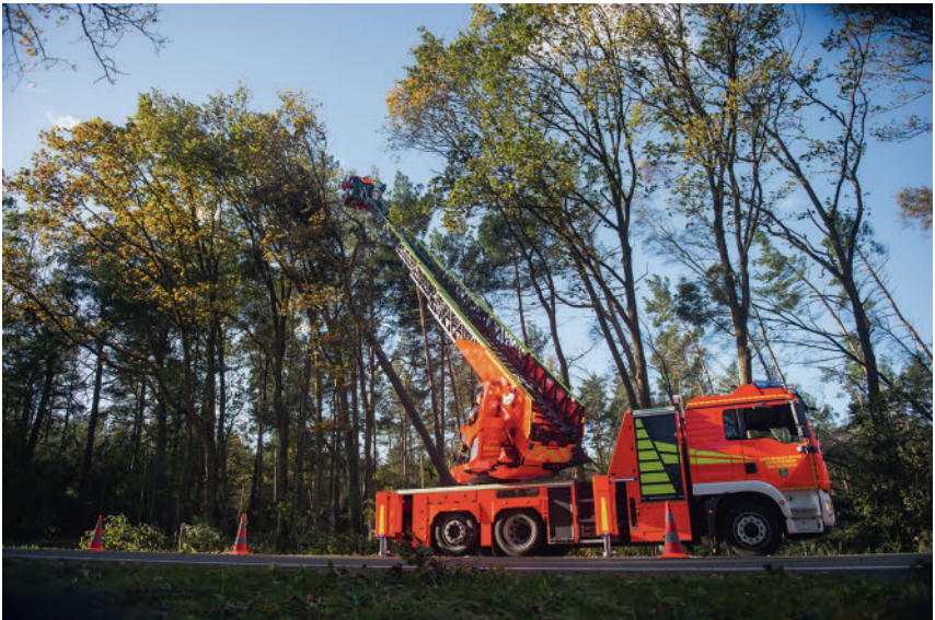
Bild 2: Technische Hilfeleistung: Hubrettungsfahrzeuge außerhalb des Fallbereiches von herabstürzenden Teilen positionieren, möglichst mit weiter Ausladung über das Fahrzeugheck arbeiten.

Maßnahmen zur Beseitigung von Gefahren für Leben, Gesundheit oder Sachwerte, die durch Explosionen, Elementarereignisse, Unfälle oder ähnliche Ereignisse entstanden sind und nicht in die Einsatzarten Menschenrettung, Anleiterbereitschaft oder Brandbekämpfung einzuordnen sind, werden der Einsatzart Technische Hilfeleistung zugeordnet.